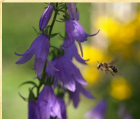
Nældekløkke (med rødhalet høstbi)