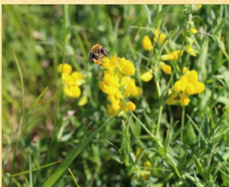
Kællingetand (med langhornsbi)