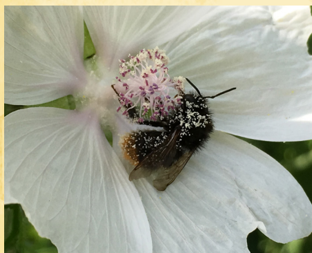
Moskus Katost (med stenhumle)

Gode idéer til andre buske og blomster er f.eks.: hindbær og solbærbuske, kæmpe jernurt, kornblomst, asters, skt. hansurt, lavendel, solsikke, stokrose, kattehale og krydderurter som perløg, salvie, oregano, timian og citronmelisse.