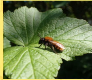
Rødpelset jordbi.

Kig godt efter, når I går ud og leder, I kan finde dem mange steder. Ved blomster, i mure, i jorden og bare flyvende rundt i luften. Så kan I bagefter snakke med hinanden og de voksne om, hvordan I bedst kan hjælpe bierne lige der hvor I bor.